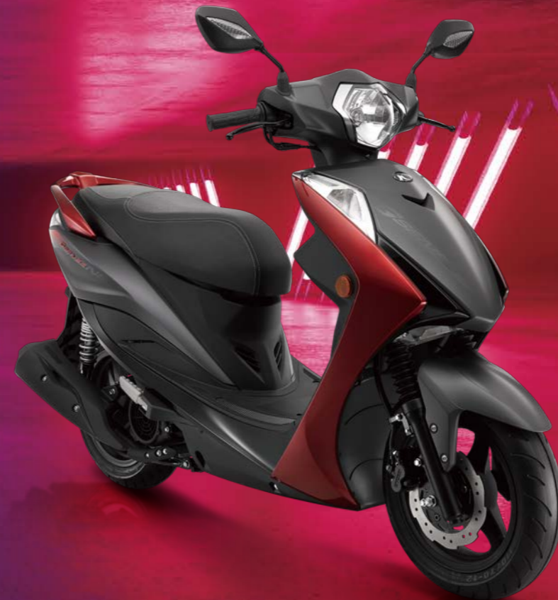
一般版 (SR25KA) / noodoe版 (SR25KC)